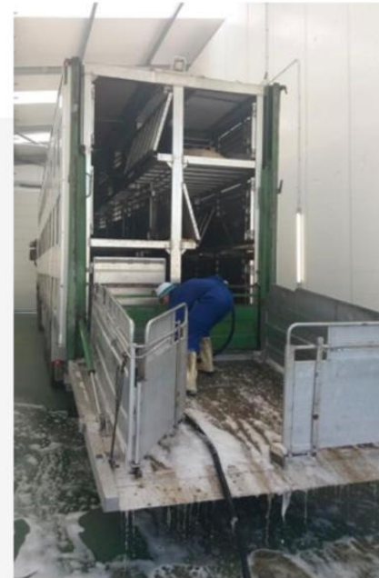
▶ Zona de lavado