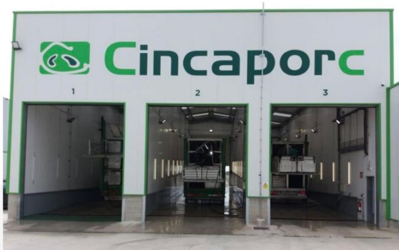
▶ Vista desde la zona sucia