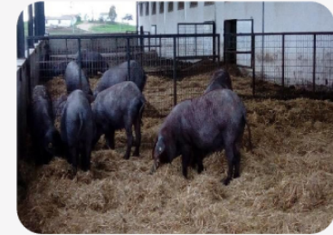
Conducta exploratoria del cerdo (Fotos: Emma Fàbrega y Rafael Muñoz).